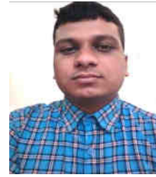
ତନ୍ମ ଶେଖର ଗୋ