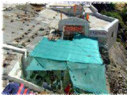
(ପାହାଡ଼ ଉପରୁ କମଣ୍ଡଳ କୁଣ୍ଡ ମନ୍ଦିର)