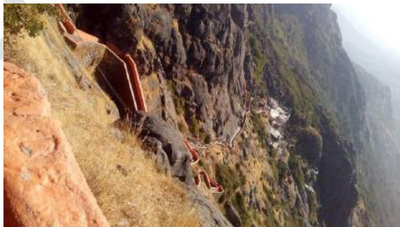
(ଫେରିବା ବେଳେ ଚଢ଼ିଥିବା ୨୫୦୦ ପାହାଚ )

ଯାହା ଆରମ୍ଭ କଲୁ ୧୨.୨୫ ରେ । ୧୦୦୦ ପାହାଚ ଓଲ୍ଲେହିବାର ଥିଲା । ଆସ୍ତେ ଆସ୍ତେ ଅତିକ୍ରମ କରି ଆସିଲୁ ୧୦୦୦ ପାହାଚ । ଏବେ ପୁଣି ଚଢ଼ିବାକୁ ପଡ଼ିବ ୨୫୦୦ ଅତି ଡିଗ୍ରୀ ପାହାଚ, ଯାହାକୁ ଓଲ୍ଲେହିବାକୁ ଆମକୁ ମଜା ଲାଗିଥିଲା । ଏଥର କନ୍ଥ ଚଢ଼ିବା । ପ୍ରଥମ ୧୦୦, ୨୦୦ ପାହାଚ ଚଢ଼ି ଗଲପରେ ପ୍ରତି ୨୦, ୩୦ ପାହାଚ କମ୍ପା ପ୍ରତି ବାଙ୍କ ରେ ଚଢ଼ିବାକୁ ପଡୁଥିଲା । ଗୋଡ଼ ବୋଲ ମାନବା ଅବସ୍ଥା ରେ ନଥିଲେ, ତଥାପି ସାହସ ଦେଖେଇ ଆସ୍ତେ ଆସ୍ତେ ଚଢ଼ିଲୁ । ଗଲବେଳେ ଯେଉଁ ଜାଗାରେ ବସି ଖାଇଥିଲୁ, ସେହି ଜାଗାରେ ଆଉ ଥରେ ବସିଲୁ । ସମସ୍ତଙ୍କ ପାଖରୁ ପାଣି ସରି ସରି ଆସୁଥାଏ । ଭୋକେ ପିଇ, ଟିକେ ଆଗକୁ ଯାଉଥାଉ । ଅଳ୍ପ ଅଳ୍ପ ପାଣି ବଞ୍ଚେଇବାକୁ କହିଲି, କାରଣ ଅମ୍ବାଜି ମନ୍ଦିର ଯାଏଁ କୌଣସି ଦୋକାନ ନଥିଲା ।