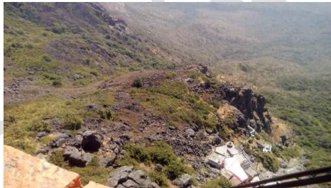
(ଗୁରୁ ଶିଖର ରୁ କମଣ୍ଡଳ କୁଣ୍ଡ ର ଦୃଶ୍ୟ )

ଯେଉଁ ରାସ୍ତା ଦେଇ ଆସିଥିଲୁ ଏବେ ଫେରିବୁ ସେହି ରାସ୍ତା ରେ..... ପୁଣି ୧୦୦୦୦ ପାହାଚ। ତଳକୁ ଓଲୁହେବା ବେଳେ ମୁଁ ସ୍ପଷ୍ଟ ଭାବେ ଦେଖୁ ପାରୁଥିଲି ପିଲଙ୍କ ମନରେ ଗଡ଼ ଜିଣି ଯିବାର ଖୁସି ଓ ପୁଣି ପଛକୁ, ସେହି ଅଫିସ, କାମ, କଂକ୍ରିଟ ଜଙ୍ଗଲ, କର୍ପୋରେଟ ଲାଇଫ କୁ ଫେରି ଯିବାର ଦୁଃଖ। ତେବେ ଫେରିବାକୁ ତ ପଡ଼ିବ। ଅତ୍ୟନ୍ତ ଆଉ କଛି ଘଣ୍ଟା ମନ ଖୁସିରେ ପ୍ରକୃତି କୋଳ ରେ କଟେଇ ଦିଆଯାଉ। ଥଣ୍ଡା ପବନ ଖାଇ ପୁଣି ମାତିଗଲୁ ଜଣେ ଅନ୍ୟଜଣଙ୍କ ଗୋଡ଼ ଟାଣିବାରେ.... ବାଟରେ କିଏ କଣ କରିଛି, କିଏ କେମିତି ଚାଲୁଥିଲା, କଣ କଣ ସବୁ ଘଟିଥିଲା ସେ ବିଷୟରେ ସବିଶେଷ ବିବରଣୀ ସହ ଅନ୍ୟର