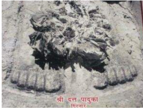
(ଗୁରୁ ଦତ୍ତାତ୍ରେୟଙ୍କ ପାଦୁକା )