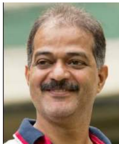
ମୂଳ ରଚନା (ହିନ୍ଦୀ) : ଧରମ ଦୁବେ