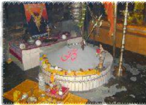
(ଅଖଣ୍ଡ ଧୂନ ରୁ ବାହାରୁଥିବା ବିଭୁତି ଯାହା ପ୍ରତି ସୋମବାର ବାହାରକୁ ଅଣାଯାଏ )