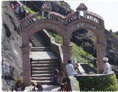
(ଶ୍ରୀ ଗୁରୁ ଦତ୍ତ ଦ୍ୱାର )