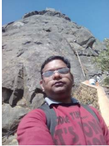
(ଗୁରୁ ଶିଖର ପର୍ବତ)