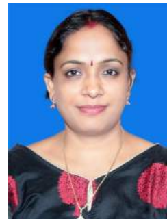
ଝିଲ୍ ମିଲ୍ ସାହୁ

କଥା ଦେଇଥିଲ ଏ ସନ ହୋଲିରେ ଆସିବ ଫଗୁଣର ସାତରଙ୍ଗ ନେଇ ସୀମା ଏ ପାଖରୁ ଆସିଛି ଖବର ତୁମେ ଆଉ ଜମା ଫେରିବନ ବୋଲି ।।