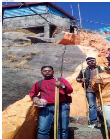
(ଗୁରୁ ଦତ୍ତାତ୍ରେୟ ମନ୍ଦିର -- ଗୁରୁ ଶିଖର ୧୦୦୦୦ ପାହାଚ)