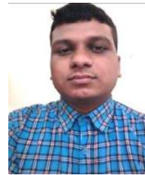
ଚନ୍ଦ୍ର ଶେଖର ଗୋ