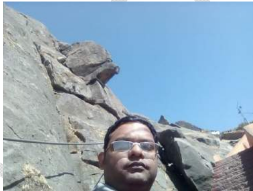
(ହାତୀ ମୁଣ୍ଡ ପଥର ଥିବା ପାହାଡ଼ )

ବଡ଼ି ଭେର ୪.୪୫ ରୁ ଆରମ୍ଭ କରିଥିଲୁ ଚଢ଼ିବା, ସରିଲା ୧୧.୪୫ ରେ। ବିଗତ ଗୁରୁ ବର୍ଷ ରେ ଏକକାଳୀନ ତିନି କଲେମିଟର ଗୁଲି ନଥିବା ମୋ ଶରୀର ଟି ଯେ ଦୀର୍ଘ ସାତ ଘଣ୍ଟା ର ଯାତ୍ରା, ୧୦୦୦୦ ପାହାଚ ଅତିକ୍ରମ କରି ଏ ଜାଗାରେ ପହଞ୍ଚି ପାରିବ ଏ ଆଶା ନଥିଲା। ଜାଣିନି, ଭଗବାନଙ୍କ ଆଶୀର୍ବାଦ ଥିଲା କି ମୋ ଇଚ୍ଛାଶକ୍ତି ତେବେ ମୁଁ ଠିଆ ହୋଇଥିଲି ଗୁଜରାଟ ର ଅର୍ଜାଧିକ ଲୋକ ଚଢ଼ି ପାରି ନଥିବା ଜାଗାରେ। କୁହନ୍ତି, ଜଗା ର ଡୋରୀ ନ ଲାଗିଲେ ପୁରୀ ବଡ଼ଦେଉଳ ବାହାରେ ଥାଇ ମଧ୍ୟ ଦର୍ଶନ ମିଳେନାହିଁ। ଏଠି ଗୁଜରାଟୀ ମାନଙ୍କ ବିଶ୍ୱାସ ଯେ, ଭଗବାନଙ୍କ ବରଦ ନଥିଲେ ତୁମେ ଗୁରୁଶିଖର ଯାଏଁ ପହଞ୍ଚି ପାରିବ ନାହିଁ। ତେଣୁ ପାହାଡ଼ ଉପରକୁ ଗୁହଁ ଆଉ ଥରେ ମୁଣ୍ଡିଆ ଟିଏ ମାରି, ପୁଣି ଥରେ ମୋତେ ଡାକିବ ବୋଲି ଭଗବାନଙ୍କୁ କହି ଫେରିବାକୁ ଉଦ୍ୟତ ହେଲୁ।