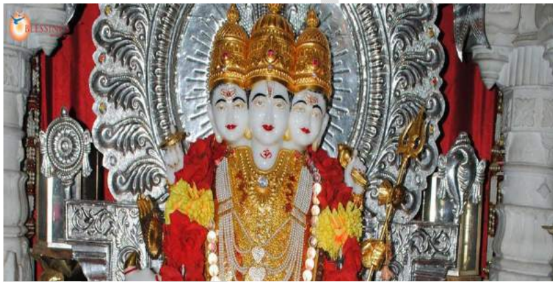
(ଗୁରୁ ଦତ୍ତାତ୍ରେୟ )