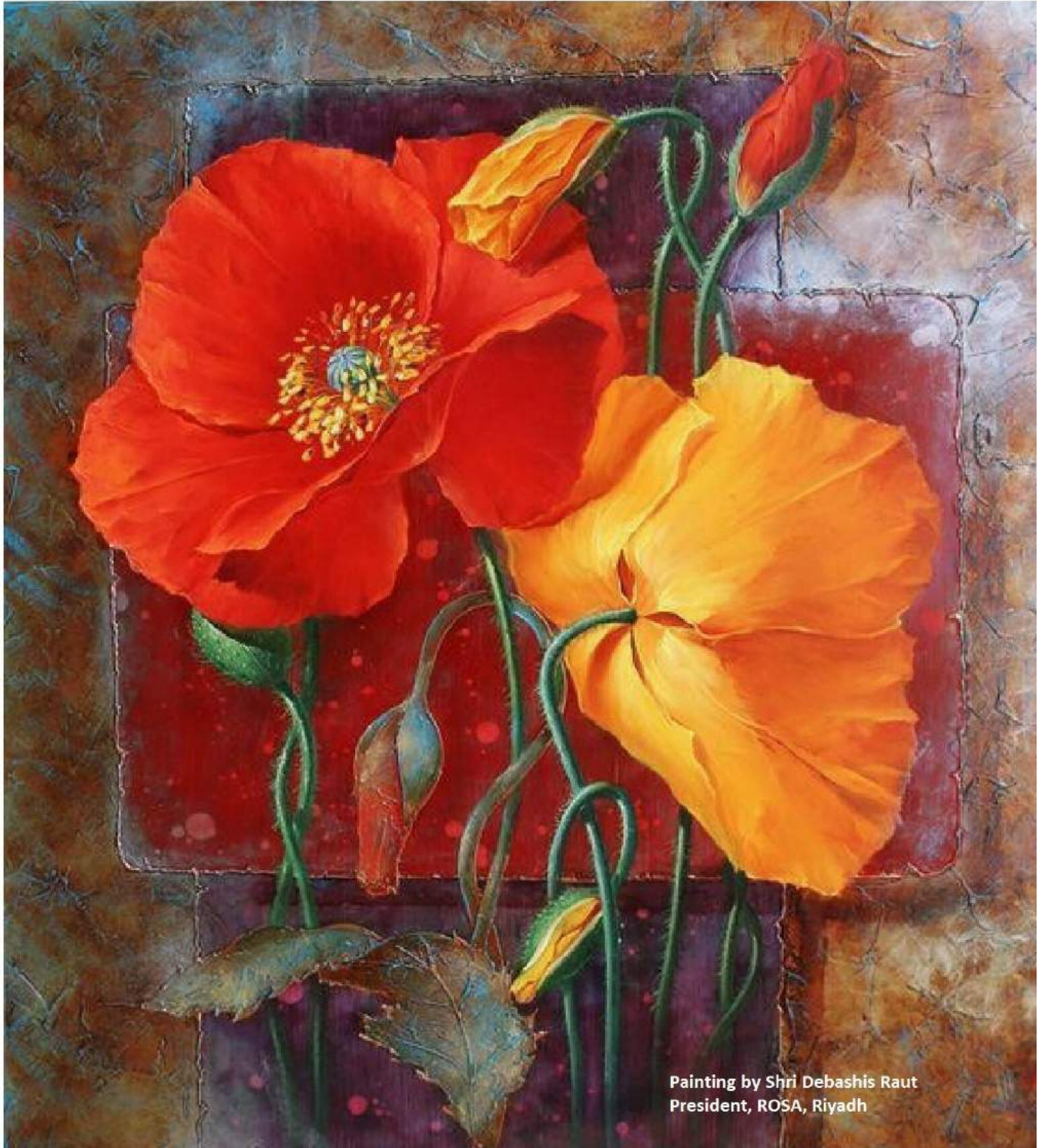
Painting by Shri Debashis Raut President, ROSA, Riyadh