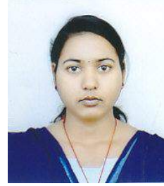
ସ୍ଵାତୀ ବେଦନା କର

ପ୍ରେମ ଯେ ସଜାଏ କା ଆଖିରେ ସ୍ଵପ୍ନ ଜୋଛନାର ଜହ୍ନରୁତି । ପ୍ରେମ ଯେ ସଜାଏ କା ତନୁରେ ଭ୍ରମ ଅଦେଖା ଅଶ୍ରୁର ତାତି ॥ ସାଉଁଟି ଖୋଜୁଥାଏ ସେ ଶାମୁକା ଭିତରୁ ମୋତି ହୃଦୟ ମନ୍ଦିରେ ଜାଲୁଥାଏ ବସି ପ୍ରେମପାଇଁ ନିତି ବତି ପ୍ରଣୟ ପସର ଭେଟି ସେ ସାଉଁଟି ଲେଡି ବସେ ପାଶେ ସାଥୀ ॥ ସପନତ ଭଙ୍ଗେ ସମୟତ ବିତେ ଭରିଯାଏ ମନେ କୋହ କେତେଯେ ପଲକେ ସ୍ମୃତି କୁ ସାଉଁଟି ନୀରବେ ଅନ୍ତର ଦେହ ବିରହ ବେଦନା ସହି ସହି ସିଏ ପାଷାଣ କରଇ ଛାଡି ॥