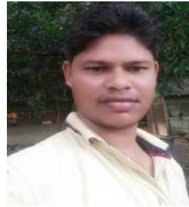
ପ୍ରସନ୍ନ ପ୍ରୟାସ ଭୂଏ (ପ୍ରୟାସ)

ଦୟା ଧୂରଜ୍ କେତେ ଦେଖାମା ସହି ନ ହଏ ଆଉ ରକମ୍, ସହେବାର୍ ସମା ଟପି ଗଲ୍ଲନ ମୁଲ୍'ହୁ କରିଦେମା ଖତମ୍ । ଉତାକେ ଉତା ମାଡି ବସୁଛନ୍ ପଛାଡୁ ଫିକୁଛନ୍ ବମ୍, କେତେ ସହେବୁ ଆଉରେ ଜୀବନ କେତେ ଧର୍ବୁ ଆର୍ ଦମ୍ । କେତେ ବୀର୍ ଜୀବନ୍ ହରଲେ ରକତେ ଭିଜଲ୍ ମାଁର୍ ଛାତି, ସାର୍ ଦେଶେ କାଲ୍ ପଡିଗଲ୍ ଯେଛା ହରିଆଲି ଉଆଁସ ର୍ତି । ଭିଜିଗଲ୍ ଦେଶ୍ ଲୁହର୍ ଧାରେ ମାଏଟ୍ ହେଲ୍ ରକତେ ଉଦା, ତାକର ବଲିଦାନ ବେକାର ନହଏ ପାକସ୍ତାନ କରଦେମା ପଦା । ହେଁକେଇ କାନ୍ଦୁଛେ ଭରତ ମାଁ ଅନାଥ୍ ହେଲେ କେତେ ଛୁଆ ,