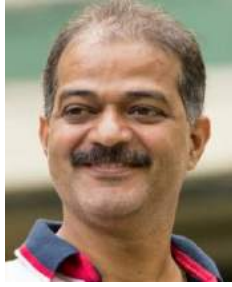
ମୂଳ ରଚନା (ହିନ୍ଦୀ) : ଧରମ ଦୁବେ