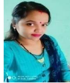
ମୋନାଲିସା ପ୍ରିୟଦର୍ଶିନୀ ନନ୍ଦ

ପ୍ରତ୍ୟେକ ରୌଦ୍ର ତାପରୁ ବସୁମତୀ କ୍ରମେ ମୁକ୍ତି ହୋଇଛି | ଶ୍ରୀବତ୍ସ ର ଧାରା ରେ ଧରଣୀ ରାଣୀ ସାନ୍ନ୍ୟାସ ଅନୁଭବ କରୁଛି | ଓଦା ମାଟିର ଗନ୍ଧ ରେ ମନ ପୁଲକିତ ଆଜି ସୁଷମା ର ବହୁତ ଖୁସି ଯେ ଆଜି କାରଣ ତାର ବହୁତ ଦିନର ସ୍ୱପ୍ନ ଆଜି ସାକାର ହେଉଛି | ଆ.ଏ (+2) ପରେ ଘରେ ରୁହୁଥିଲେ ତାକୁ ବିବାହ କରିଦେବା ପାଇଁ କନ୍ୟା ତାର ସହପାଠୀ ପିଙ୍କୁ ପାଇଁ ଆଜି ଯେ ତାର ଅଧିକ ସ୍ୱପ୍ନ ପୂର୍ଣ୍ଣ କରିପାରିବ | ପିଙ୍କୁ ର ତାର ଗୋଟିଏ ଭଲ କଲେଜରେ ନାମ ଲେଖାଇଲେ | ପିଙ୍କୁ ଆଉ ସୁଷମା ବହୁତ ଭଲ ସାଙ୍ଗ | ଦୁଇଜଣ ହାଣ୍ଡେଲ ରେ ରହିବା ପାଠ ପଢ଼ିଲେ | ଯେ ଦୁଇଜଣ ଜାଣି ଭିତରେ ବନ୍ଧୁତା ଛଡ଼ା ଆଉ କୌଣସି ସମ୍ପର୍କ ଦେଖାଯାଉନଥିଲା | କନ୍ୟା ଭଲ ଲାଜୁର ବାପା ମା ଭାବିନେଇଥିଲେ ଦୁଇଜଣ ଜାଣି ବିବାହ କରିବା ପାଇଁ | ଦୁଇ ପରିବାର ଯେ ଦୁଇଜଣଙ୍କ ଅଜଣାତରେ ପରସ୍ପର ସମ୍ପର୍କ ସମ୍ପୂର୍ଣ୍ଣ ସମ୍ପୂର୍ଣ୍ଣ ହୋଇଯାଇଥିଲେ | ପିଲାମାନଙ୍କ ର ପାଠ ପଢ଼ାରେ ବ୍ୟାଘାତ ହେବ ବୋଲି ଏସବୁ ବିଷୟରେ ତାଙ୍କୁ କହିବି ଜଣାଇ ନଥିଲେ |