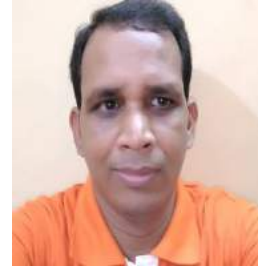
ଓଡ଼ିଆ ଭାଷାନ୍ତର: ସନାତନ ମହାକୁଡ଼