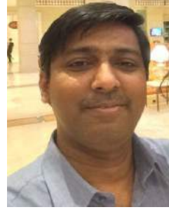
ରଞ୍ଜଣେଶର ସି “ବମା”

ପାବନ କାର୍ତ୍ତିକ ମାସ ହେଲୁ ପ୍ରାରମ୍ଭ, ଦୀପାବଳି କାଳୀପୂଜାର ପାର୍ବଣ ହେଲୁ ଆରମ୍ଭ | ୧ |