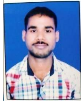
ରମ ତନ୍ତ୍ର ପ୍ରଧାନ