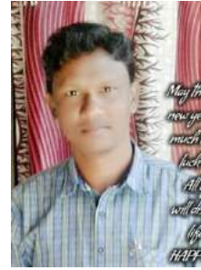
ଶ୍ରୀ ତମ୍ବୁର ବାଗ

ଦେଖିଲି ନୟନେ ଶ୍ରମିକ ଭାଇଙ୍କୁ ଆସୁଥିଲେ ଚାଲି ନଜ ଗାଆଁକୁ । ମୁଣ୍ଡରେ ବୁରୁକା କାନ୍ଧେ ଛୋଟ ପୁଅ ହାତେ ହାତ ଧରି ବଡ଼ ପୁଅକୁ । ଥପ୍ ଥପ୍ ହୋଇ ଝାଳ ବାହାରୁଥିଲ ଶୁଖି ଯାଇଥିଲ ପାଟିଟା ତା'ର । ମୁହଁଟି ତାହାର କଳା ପଡ଼ିଥିଲ ନ ଥିଲ ପେଟରେ କିଛି ଆହାର । ସହସ୍ର ଯୋଜନୁ ପାଦେ ଚାଲି ଚାଲି ପଡ଼ି ଯାଇଥିଲ ସେ ଭାଇ ଥକ । ଭୋକ ଭୟାମରେ ପେଟ ଜଳୁଥିଲ ଚାଲୁଥିଲ ରସ୍ତା ସେ ଟାକ ଟାକ । ମନେ ଭରୁଥିଲ ନଜ ଘର କଥା ଝୁରି ହେଉଥିଲ ରେଗୀ ମାଆକୁ । ଛାଡ଼ି ଆସିଥିଲ ବଡ଼ ଝିଅଟାକୁ ବାହା ଦେବ ବୋଲି ଆର ବର୍ଷକୁ । ଆଖିରୁ ବହଇ ଲୁହ ଧାର ଧାର ଯେତେ ପୋଛିଲେ ବି ବାହାରୁଥାଏ । ଗରିବ ବିଚର ଶ୍ରମିକ ଭାଇନା ମନେ ମନେ କାନ୍ଦି ପାଦ ବଜାଏ । ଛୋଟ ଛୁଆ ତା'ର ନ ଜାଣଇ କିଛି ବାପା କାନ୍ଧେ ବସି ପରୁରୁ ଥାଏ ।