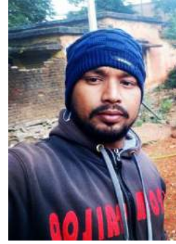
ତପନ କୁମାର ଦାଶ

ଗୋଟିଏ ଗଛରେ ଦୁଇଟି ପକ୍ଷୀ ବସା ବାନ୍ଧିଥିଲେ | କାଉ ଓ ବଗ | ଦୁହେଁ ଘନଷ୍ଟ ବନ୍ଧୁ | ଦୁହେଁ ଦୁହିଁଙ୍କୁ ଅସୁବିଧା ବେଳେ ସାହାଯ୍ୟ ସହଯୋଗ କରନ୍ତି | ଯାହା ଆଣନ୍ତି ମିଳମିଶି ବାଣ୍ଟିକୃଷ୍ଣି ଖାଆନ୍ତି | କିନ୍ତୁ ଦୁଇଟି ଭିନ୍ନ ଶାଖାରେ ଦୁହିଁଙ୍କର ଅଲଗା ନୀତି ଥାଏ | ଦୁହେଁ ଖୁସିରେ ଜୀବନ ଜୀବନ କରୁଥାନ୍ତି |