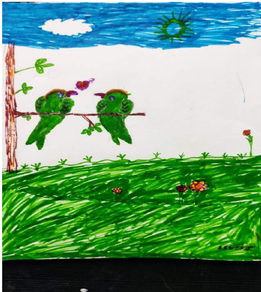
ରବୀନ୍ଦ୍ର ଭରତୀ ଗ୍ଲୋବାଲ ସ୍କୁଲ, ବାଙ୍କାଲେର