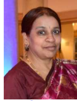
ଡକ୍ଟର ବିଜ୍ଞାନୀ ଦାସ