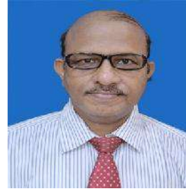
ଭଦ୍ରର ଚନ୍ଦ୍ର ଶଶ୍ୱା

ହୁଏ ନାହିଁ ଦେଖୁ ତାକୁ ଦେଖାଇବି ହୁଏ ନାହିଁ କରି ହୁଏ କେବଳ ଅନୁଭବ ସେ ତ ଏକ ଅଜାଗା ଘାଆ ଘୋର ଅନ୍ଧକାର ଭିତରେ ଚକ୍ ଚକ୍ ଆଲୁଅ ପରି ଝଲସି ଉଠୁଥାଏ ସିଏ ବାନ୍ଧି ଗଲେ ଥରେ ସେଇ ବସା ଭାଙ୍ଗେ ନାହିଁ ସହଜରେ ଆଲୋକରୁ ରହେ ସେ ଦୂରେଇ ପାଇଥାଏ ଭଲ ଅନ୍ଧାରକୁ ୧୧ ।