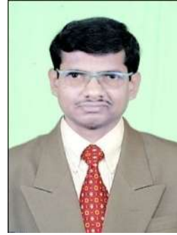
ଡାକ୍ତରୀ ସାଧକ ଜେନା

ସୁନାର କୁଲେଇ ପାଛୁଡ଼ି ଥିଲୁ ତୁ ରୂପାର ଧାନକୁ ବୁଣି ମନର କୁଲେଇ ପାଛୁଡ଼ି ଦିଏ ଲେ ଭବର ଧାନକୁ ଖାଣି .....ସୁନାର କୁଲେଇ ପାଛୁଡ଼ି ଥିଲୁ ତୁ ରୂପାର ଧାନକୁ ବୁଣି ! ୦ !