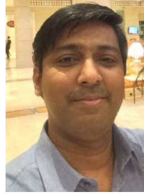
ରଞ୍ଜଣେଶର ସି 'ଚମା'

ଜୀବନରେ ମନ ନହେଲେ ଅନେକ ପ୍ରକାର, ଯୌବନରେ ପ୍ରଣୟ କେତେଯେ ମନୋହର, ଯାହାର ଆନନ୍ଦଜନକ ପ୍ରୀତି ଯେ ପ୍ରକାଶକର, ହୃଦୟରେ ସୃଷ୍ଟିହୁଏ ନର୍ମଳ ହିମାଳୟ ପରିସର | ୧ |