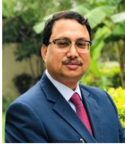
ଡ. ଅରୁଣ ପ୍ରହରାଜ

(Top 20 Personalities Of Odisha 2020: Exalting Odia Pride)