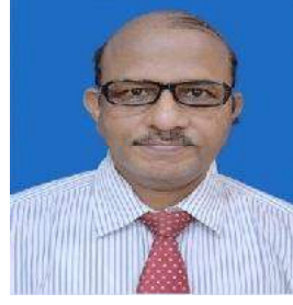
ଭଦ୍ରର ଚନ୍ଦ୍ର ଖଣ୍ଡା

ହେ ସମୟ ! ହେଉଛି ପ୍ରବଳ ଇଚ୍ଛା ଶୋଇବାକୁ ଥରେ ତୋ କୋଳରେ ପାଇବାକୁ ତୋ ଉତ୍ସୁକ ପରଶ ପାଆନ୍ତିନି ଦେଖିବାକୁ ଯେଉଁଠି ଆବଦ୍ଧ ଭିତରେ କୃତ୍ରିମତାର ତରଂଗ ।୧।