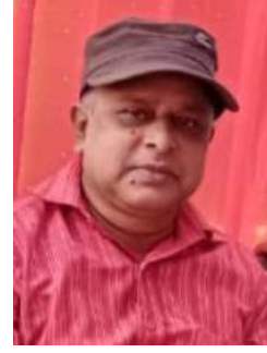
ଜୁମର ନାଥ ପାତ୍ର