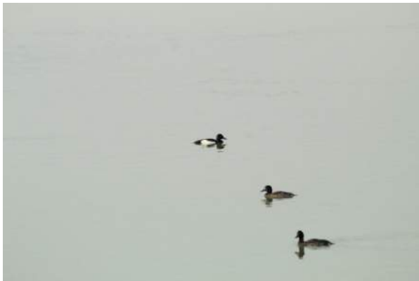
ସମରଝୋଳ, ଗଂଜାମ, ଓଡ଼ିଶା

କିନ୍ତୁ ସବୁ ବିଷୟକୁ ଚଳକାରୁ ଫେରିଲାପରେ ସାଙ୍ଗମାନଙ୍କୁ ଜଣାଇଲା । ସମସ୍ତେ ଚଳିକା ଓ ପ୍ରବାସୀ ପକ୍ଷୀ ବିଷୟରେ ସଚେତନ ହେଲେ ଓ ପରିବେଶ ସଂରକ୍ଷଣ ପାଇଁ ଆଗଭର ହେବେ ବୋଲି ନିଶ୍ଚିତ ନେଲେ ।