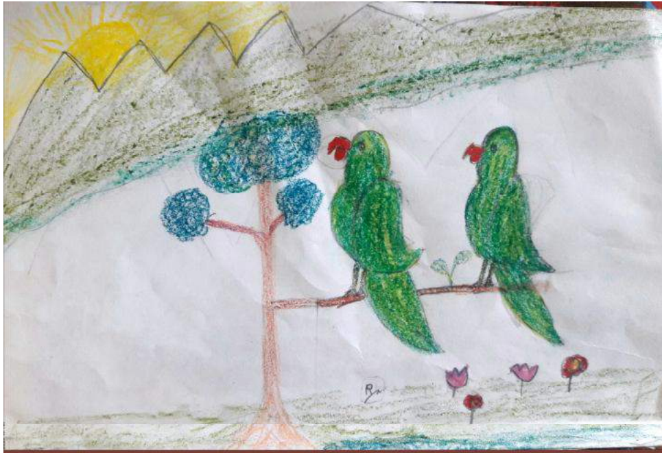
ଶ୍ଯାଣ୍ଡର୍ଡ୍ ୧, ରବୀନ୍ଦ୍ର ଭରତୀ ଗ୍ଲୋବାଲ୍ ସ୍କୁଲ, ବାଙ୍ଗାଲୋର