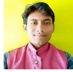
କରଣ ମୟ ସେନାପତି

ସ୍ମୃତି ଗୋ ତୁମେ ପାହାନ୍ତି ରାତିର ମିଠା ମିଠା ଏକ ସ୍ୱପ୍ନ ଓଁ ଗୋ ତୁମେ ପ୍ରେମର ରାଜଜେ ନୂଆଁ ଏକ ରୂପା ଜହ୍ନ । ସ୍ମୃତି ଗୋ ତୁମେ ବରଷା ରାତିର ପ୍ରେମଭର ଏକ ତାତି ସ୍ମୃତି ଗୋ ତୁମେ ଅତୀତ ପୃଷ୍ଠାର ଅଲିଭ୍ ଅଫେର ଗୀତି । ସ୍ମୃତି ଗୋ ତୁମେ ଯୌବନ ବେଳାର ନୂଆଁ ଏକ ଅନୁଭୂତି ସ୍ମୃତି ଗୋ ତୁମେ ଦିଗହଜା ଏକ ଜୀବନର ପରିସ୍ଥିତି । ସ୍ମୃତି ଗୋ ତୁମେ ଝରି ପଡୁଥିବା କୋହରେ ଭର ଲେତକ ସ୍ମୃତି ଗୋ ତୁମେ ପ୍ରେମୀ ଯୁଗଳଙ୍କ ସାଇତା ଶେଷ ସତ୍ତକ ।