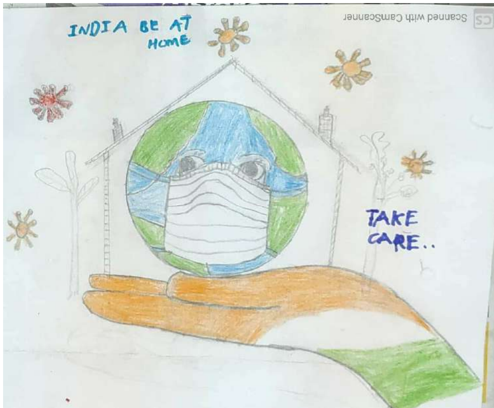
ଶ୍ଵଶୁର୍ତ୍ତ ୧, ରବୀନ୍ଦ୍ର ଭରତୀ ଗ୍ଲୋବାଲ ସ୍କୁଲ, ବାଙ୍କାଲେର