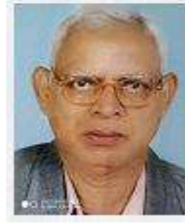
ପ୍ରଫୁଲ୍ଲ ଚନ୍ଦ୍ର ମହାନ୍ତି