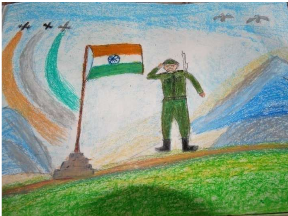
ଷ୍ଟାଣ୍ଡର୍ଡ ୨, ରବୀନ୍ଦ୍ର ଭରତୀ ଗ୍ଲୋବାଲ ସ୍କୁଲ, ବାଙ୍କାଲେର