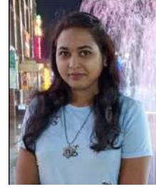
ସ୍ୱାତୀ ବନ୍ଦନା କର