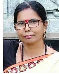
ସିପ୍ରା ନାମତା, ନମ୍ରତା