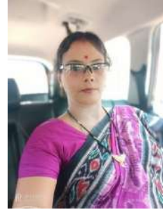
ଛବି ରାଣୀ ପତି

କଳାକାର ହୋଇ କରି ପାରୁନାହୁଁ ନିଶ୍ଚଳରେ ଅଭିନୟ ଅନଶ୍ଚିତ ବନ୍ଧନ ନଶ୍ଚିତ ମଣି ଏ ଜୀବନ ନିଃସଙ୍ଗମୟ ।