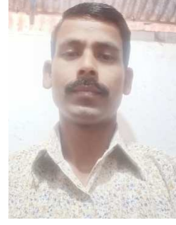
ପ୍ରଶାନ୍ତ କୁମାର ନାଥ

କେତେ କେତେ ଜ୍ଞାନୀ ଏ ଦେଶରେ ଜନ୍ମି ଲେଖି ଯାଇଛନ୍ତି ନାମ ତାଙ୍କ ମଧ୍ୟେ ଏଠି ଗଣିତଜ୍ଞ ଭାବେ ଶ୍ରୀନିବାସ ତାଙ୍କ ନାମ ।