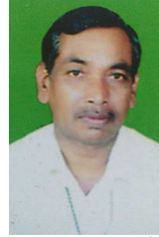
ଅକ୍ଷୟ ମହାନ୍ତି (ନିର୍ମାତା)