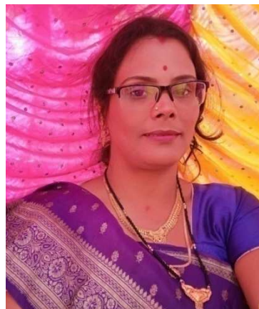
ଛବି ରାଣୀ ପତି

ଛାତିତଳ ଏକ ନିବୃତ କୋଣରେ ଭାରି ଛୋଟ ମୋର ଘର ସେ ଘର ଭିତରେ ମୋ ପ୍ରିୟ ସାଥୀରେ ରଚିଛି ପ୍ରେମ ମନ୍ଦିର ।