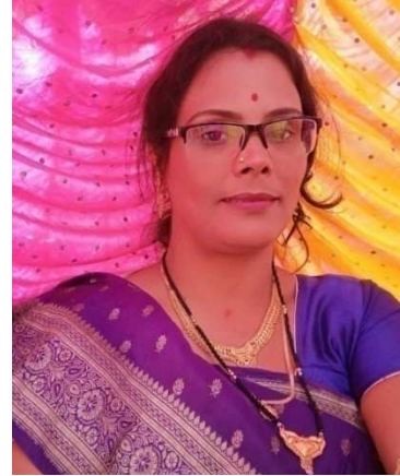
ଛବି ରାଣୀ ପତି

ଆଲିଙ୍ଗନ ପ୍ରମତ୍ତ ଯେସନେ ସାଗର ଉତ୍ତାଳ ତରଙ୍ଗ ମାଳା ଆନମନା ହୋଇ ମାଡ଼ିଆସେ ନେଇ ମଣି, ମୁକ୍ତା, ହୀରା, ଲୀଳା ।।