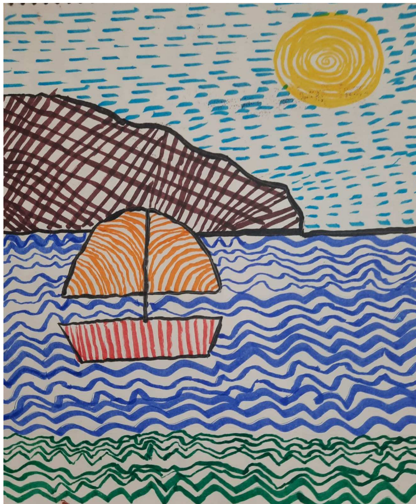
ଦିଲ୍ଲୀ ପବ୍ଲିକ ସ୍କୁଲ, ବସନ୍ତ ବିହାର, ନୂଆଦିଲ୍ଲୀ