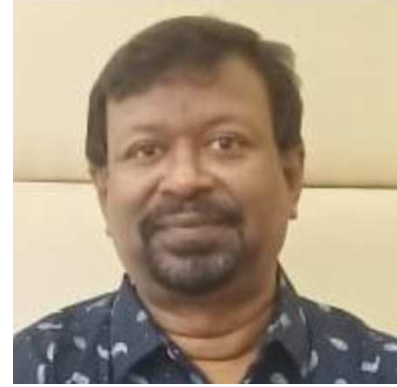
ଡୁଇଟ ଡେଭିଡ ଫୀଲିପ

ମୁଁ ବି ଗାଉଛି, ତୁମ ମନରେ ଖୁସି, ମୋ ମନରେ ନାହିଁ ତୃପ୍ତି, ମୋତେ ଏମାନେ କହୁଛନ୍ତି, ଇଏ କ'ଣ ମୁହିଁ ଶୁଖାଇ ଗାଉଛି ?